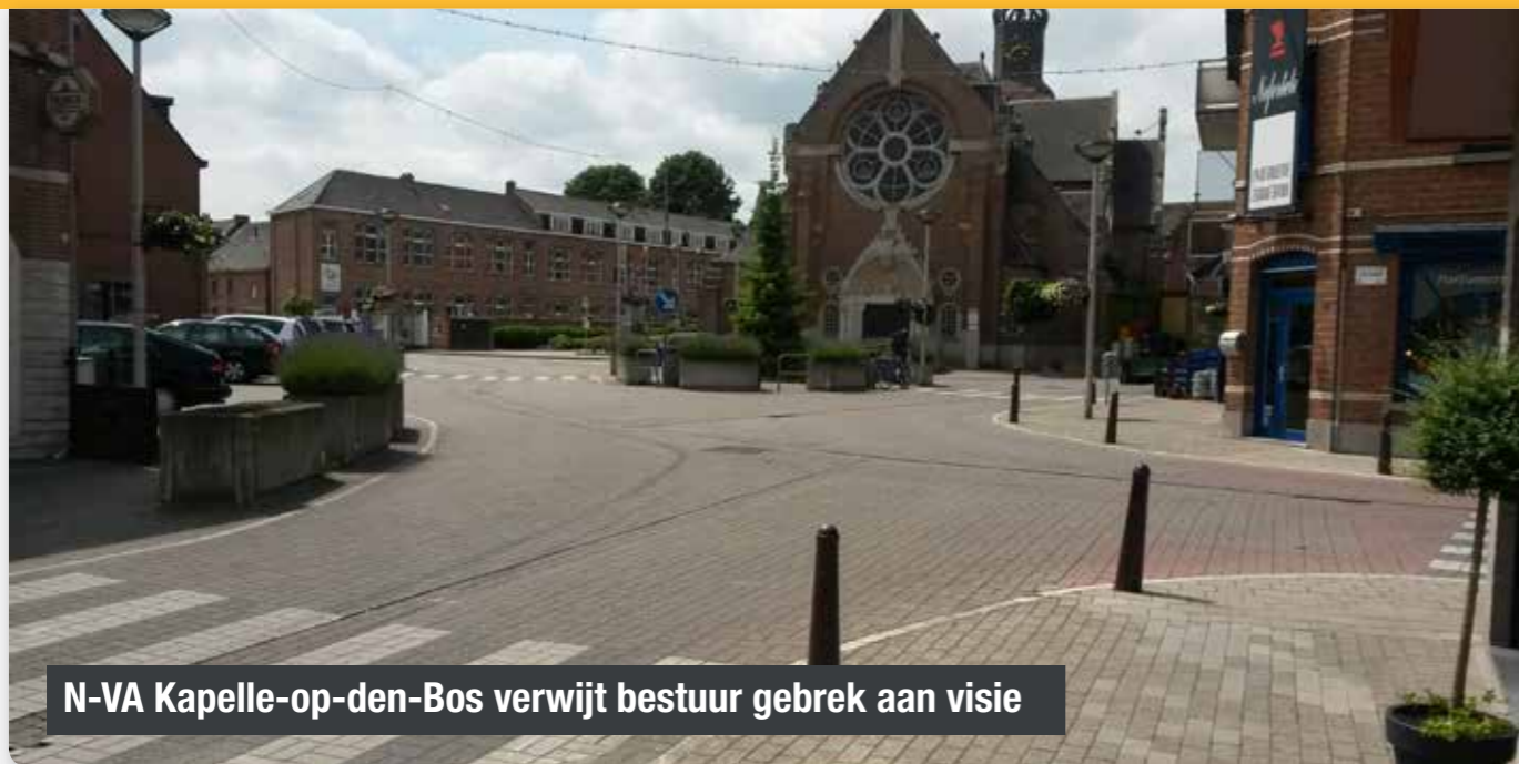
N-VA Kapelle-op-den-Bos verwijt bestuur gebrek aan visie

Op de gemeenteraadscommissie Veiligheid en Mobiliteit heeft de sp.a-CD&V-meerderheid haar plannen uit de doeken gedaan rond de herinrichting van het kruispunt aan de kerk van Kapelle-op-den-Bos. Een project dat uitblinkt in kortzichtigheid, aldus de N-VA.