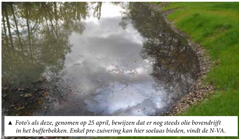
▲ Foto's als deze, genomen op 25 april, bewijzen dat er nog steeds olie bovendrijft in het bufferbekken. Enkel pre-zuivering kan hier soelaas bieden, vindt de N-VA.

N-VA Kapelle-op-den-Bos is blij dat het bufferbekken in de Stichelaar in Ramsdonk eindelijk gesaneerd werd. Maar we vrezen ook dat dit een maat voor niets zal zijn als er geen pre-zuivering gebeurt vooraleer het oppervlaktewater in de omwalling van het kasteel en zo in het bufferbekken stroomt.