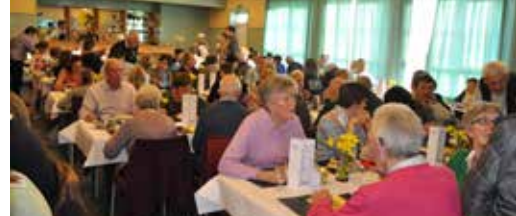
Schep veu Posse is schot in de roos p. 3