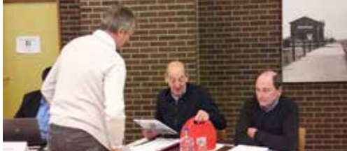
N-VA schenkt AED-toestel aan gemeente p. 2