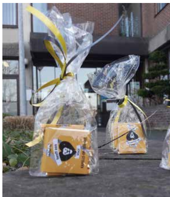
▲ De N-VA deelde chocolaatjes uit op Valentijn.

Op die manier bedankten we de personeelsleden van de gemeente voor hun inzet en goede samenwerking.