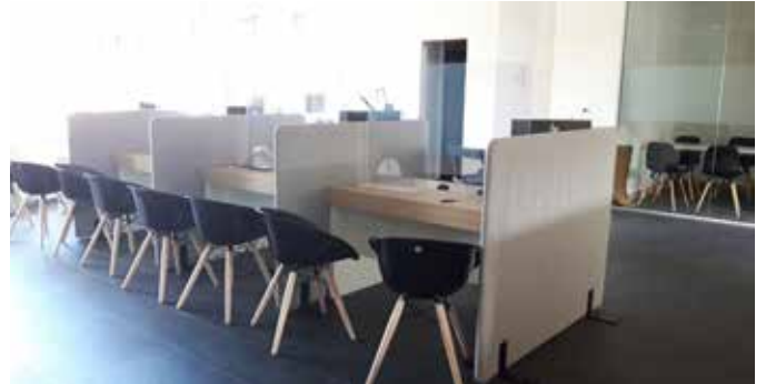
▲ In de nieuwe lokettenzaal hebben burgers meer privacy.