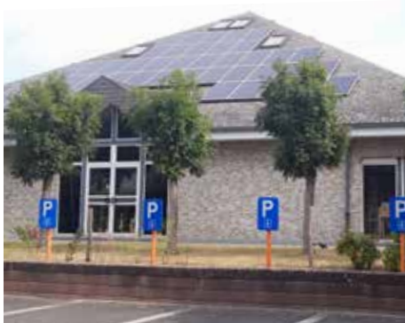
▲ Onder meer op de bibliotheek liggen al zonnepanelen.

Daarom heeft de gemeente onderzocht welke (gemeentelijke) gebouwen in aanmerking komen voor extra zonnepanelen, bovenop de reeds geplaatste zonnepanelen uit het verleden. Het sociaal huis en de buitenschoolse kinderopvang ‘t Klawierkerke