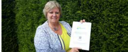
N-VA steunt de lokale economie (p. 5)