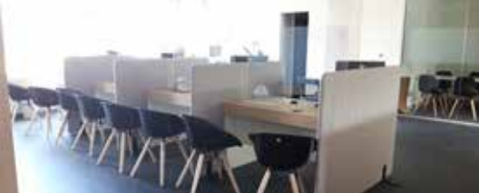
Administratief centrum in nieuw, modern jasje (p. 2)