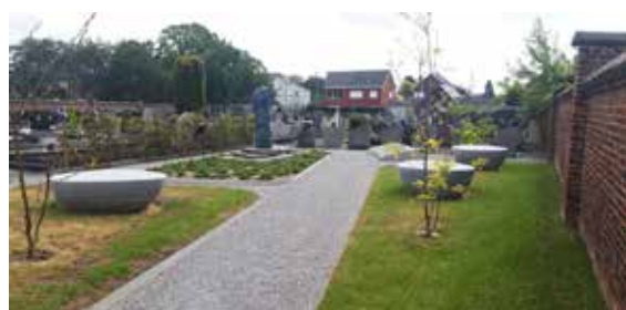
▲ De begraafplaats kreeg een nieuwe groene rustplek.

De heraanleg van het kerkhof van Kapelle-Centrum nadert zijn einde. Het oudstrijdersperk werd onlangs afgewerkt. Een mooie groene rustplek met grote platte zitstenen nodigt uit om in alle stilte even te verpozen bij een bezoek aan de begraafplaats.