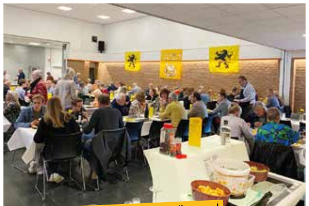
Een dikke dankjewel aan alle aanwezige Kapellenaren!

De pandemie stak er enkele jaren een stokje voor, maar op 8 oktober konden we eindelijk opnieuw genieten van onze traditionele BBQ. Zaal De Kring was goed gevuld en de aanwezigen smulden van een lekker stuk vlees en een dessert en genoten van een drankje en een babbel. Het was plezant!