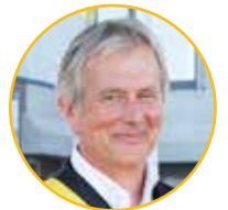
Renaat Huysmans Burgemeester

Op de binnenpagina's geven wij u een bondig en duidelijk overzicht van de maatregelen en initiatieven die het bestuur heeft genomen om de coronacrisis te bestrijden. Dit overzicht is een samenvatting en is verre van volledig, maar geeft toch goed weer dat we als bestuur al het mogelijke doen en gedaan hebben om deze coronacrisis in goeie banen te leiden.